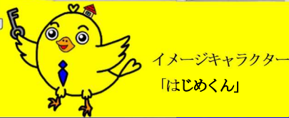
イメージキャラクター 「はじめくん」