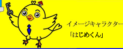
イメージキャラクター 「はじめくん」