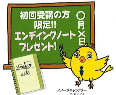
イメージキャラクター 「はじめくん」