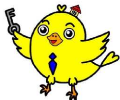
イメージキャラクター 「はじめくん」