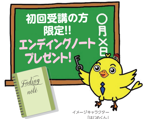
イメージキャラクター 「はじめくん」