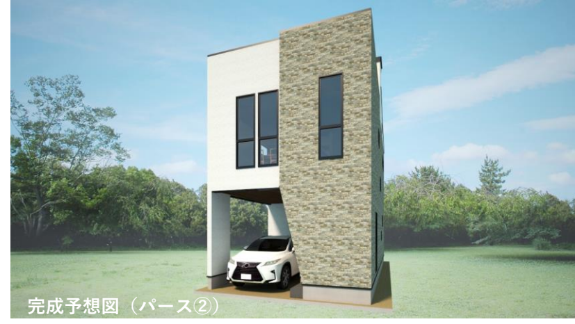
完成予想図 (パース②)

間取図 3LDK+ロフト+小屋裏収納+ペントハウス+WIC+SIC+ルーフテラス