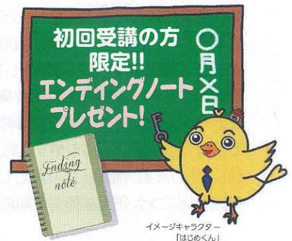
イメージキャラクター 「はじめくん」