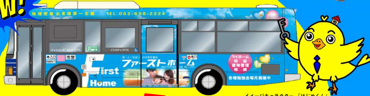
イメージキャラクター「はじめくん」