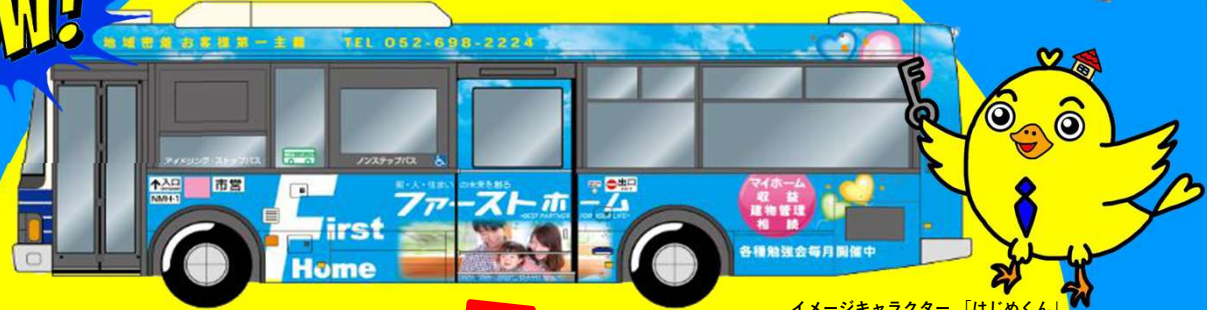
イメージキャラクター「はじめくん」