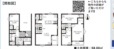
※図面と現況が異なる場合は現況優先と致します。

【物件概要】 ●所在地/名古屋港区南十一番町四丁目6番2 ●価格/3,480万円 (税込) ●間取り/4LDK ●交通/地下鉄名港線「東海道」駅 徒歩8分 ●構造/木造2階建 ●土地面積/58.00㎡ ●建物面積/107.08㎡ ●地/宅地 ●都市計画/市街化区域 ●用途地域/第一種住居地域 ●ぺい率/70% ●容積率/200% ●駐車場/1台 ●築深/北前幅員約4.54mの公道に間口約6.3m幅面 ●完成/令和4年12月 ●建築確認番号/確認済字第K122-0420-50489号 ●引渡/ ●取引態様/媒介