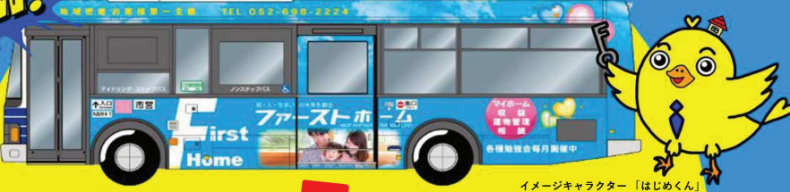
イメージキャラクター「はじめくん」