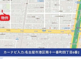
カーナビ入力:名古屋港区南十一番町四丁目6番2

月々のお支払い 頭金: 諸費用分 借入金額: 3,480万円 月々/90,335円 ※変動金利 0.5%・35年返済 ※融資条件2023年1月のものにいたします。詳細は係員にご相談下さい。