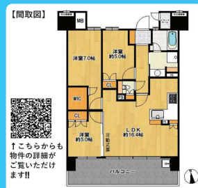
※図面と現況が異なる場合は現況優先と致します。

月々のお支払い 頭金: 諸費用分 借入金額: 3,580万円 月々/92,931円 ※変動金利 0.5%・35年返済 ※融資条件2023年1月のものにいたします。詳細は係員にご相談下さい。