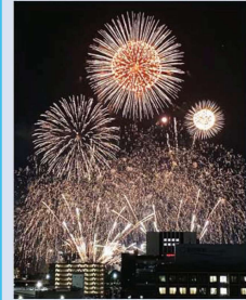
海見える南側バルコニーからは名古屋港の花火も望めます! (天気による)